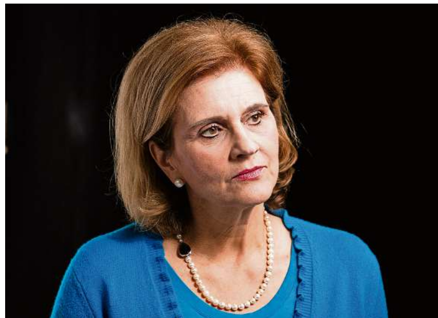
Hassprediger gemeint, vom Bistum Chur gescholten: Nationalrätin Doris Fiala stösst mit der Idee staatlich beaufsichtigter Kirchenstiftungen auf Widerstand.