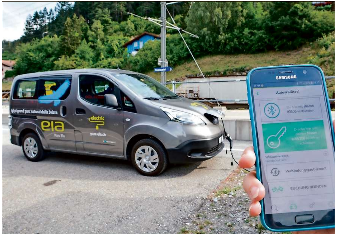
Exponias èn varsaquants autos tgi von cun forza electrica. Per exaimpel er chel digl Parc Ela.

Chegl èn quatter dallas marcas dad autos electric tgi stattan a disposiziun agls visitaders per far en gir. Iniziant